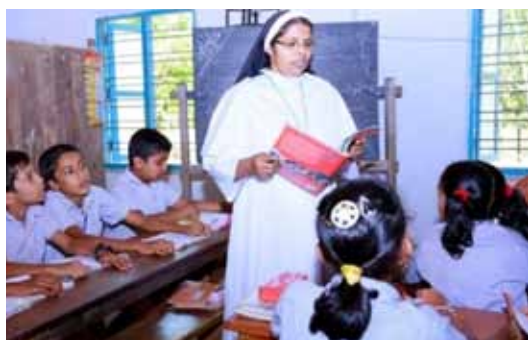
Schule in Varanasi

Bitte unterstützen Sie die nordindische Diözese Varanasi bei ihren aktuellen Projekten: Förderung von armen Kindern (tägliches Schulesse; Materialien für die Schule,...); Unterstützung von Familien der untersten Kaste; Unterstützung der Priester in ihren manchmal sehr kleinen Gemeinden (diese erhalten monatlich knapp € 80,- Euro als Gehalt; müssen damit den Haushalt und viele Hilfsarbeiten abdecken). Die Gemeindeglieder haben selbst kaum finanzielle Mittel, um eine Unterstützung zu geben, außer Naturalien. Die Ordensschwwestern (u.a. Schwestern „Königin der Apostel“ aus Wien-Hernals mit Schulen, Heimen und Blindeninstituten) benötigen (neben dem Schulgeld und einer geringen Unterstützung durch den Staat für Schulen) zumeist eine