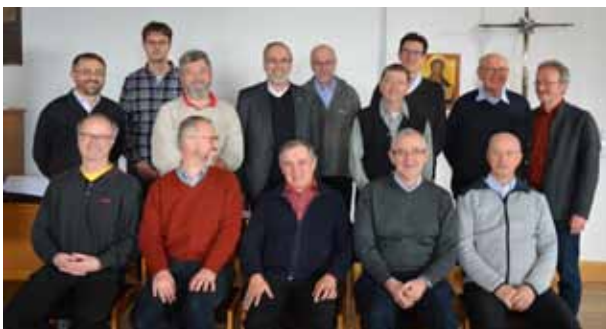
Die Mitglieder des Provinzkapitels mit dem Koordinator der Region Europa. Sitzend in der Mitte der neue Provinzial