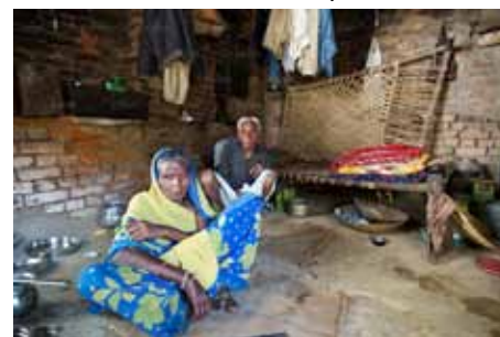
Eine arme Familie in Varanasi