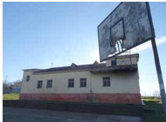
Albanien – Sportplatz mit Klemenskirche