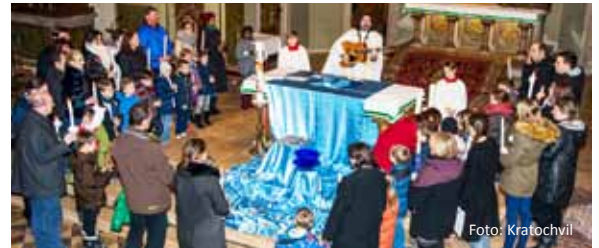
Erstkommunionkinder bei der Taufenerneuerung