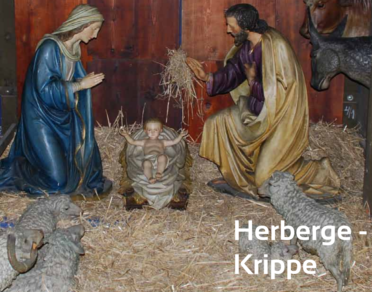
Herberge - Krippe